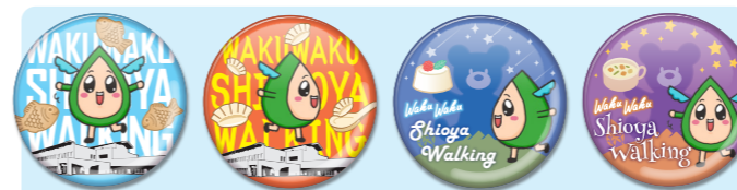
缶バッジのデザインは変更になる場合があります。

大会参加者全員に大会記念缶バッジを差し上げます。当日、各エイドステーションでは別デザインの缶バッジを配布します。