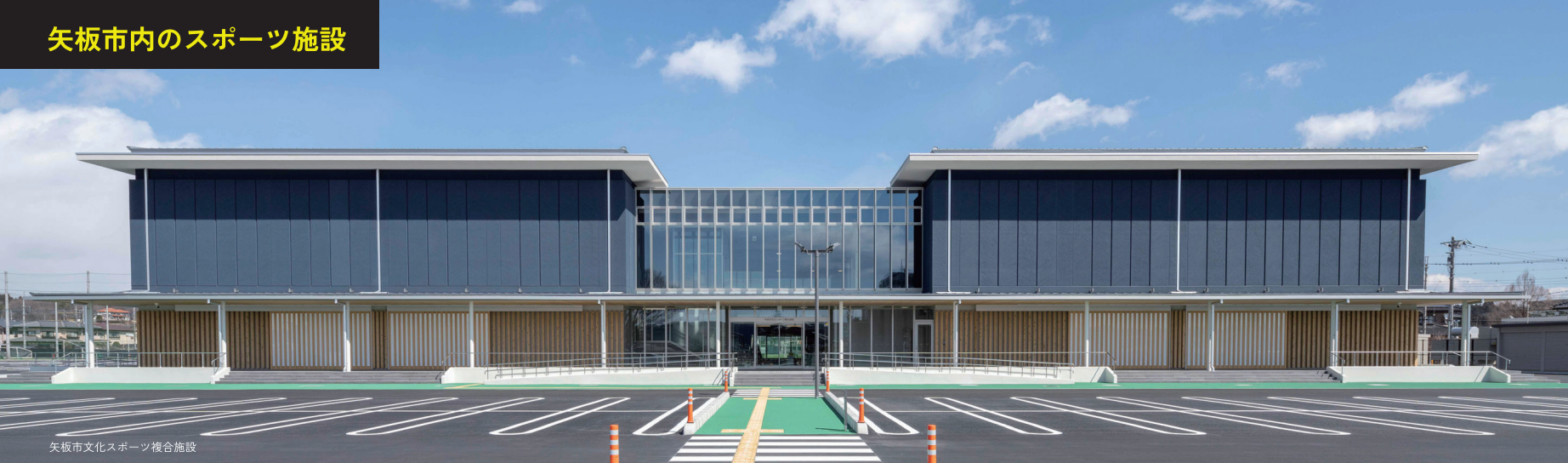
矢板市文化スポーツ複合施設