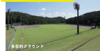
多目的グラウンド